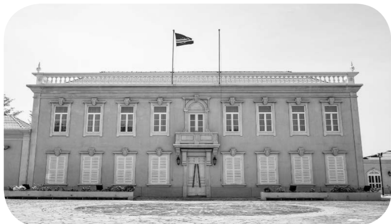
5월 12일 베르데갑 (佛得角) 수도 프리아 (普拉亚)의 베르데갑 대통령궁. 중국은 베르데갑 대통령궁 개보수 확장 (改扩建) 프로젝트를 지원했다.

올해는 중국과 베르데갑 수교 50주년이 되는 해이다. 두 나라 수교후 중국은 베르데갑에 국민의회 의사당, 정부청사, 국가경기장, 파오이아오뎬 (泡衣垆水坝) 등 여러 프로젝트를 지원했다.