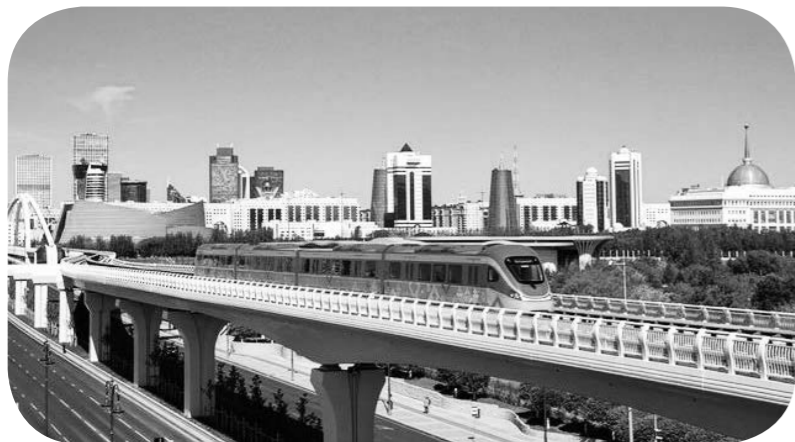
중국 기업이 건설한 까자흐스탄 수도 아스타나 경철 (轻轨) 프로젝트 1기 공사가 5월 16일 준공, 개통식을 가졌다. 까자흐스탄 대통령 토카예프는 이날 경철 첫 승객으로 시승을 했다.