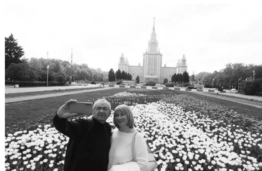
5월 13일, 로씨야 모스크바국립대학교 본관 앞 공원에서 사람들이 만발한 튜립 (郁金香)을 배경으로 셀카를 찍고 있다.