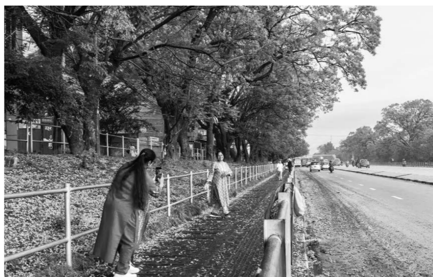
5월 14일, 네팔 카프만두 길거리에서 한 여성이 만발한 자카란다나무 (藍花楸樹) 아래에서 사진을 찍고 있다.