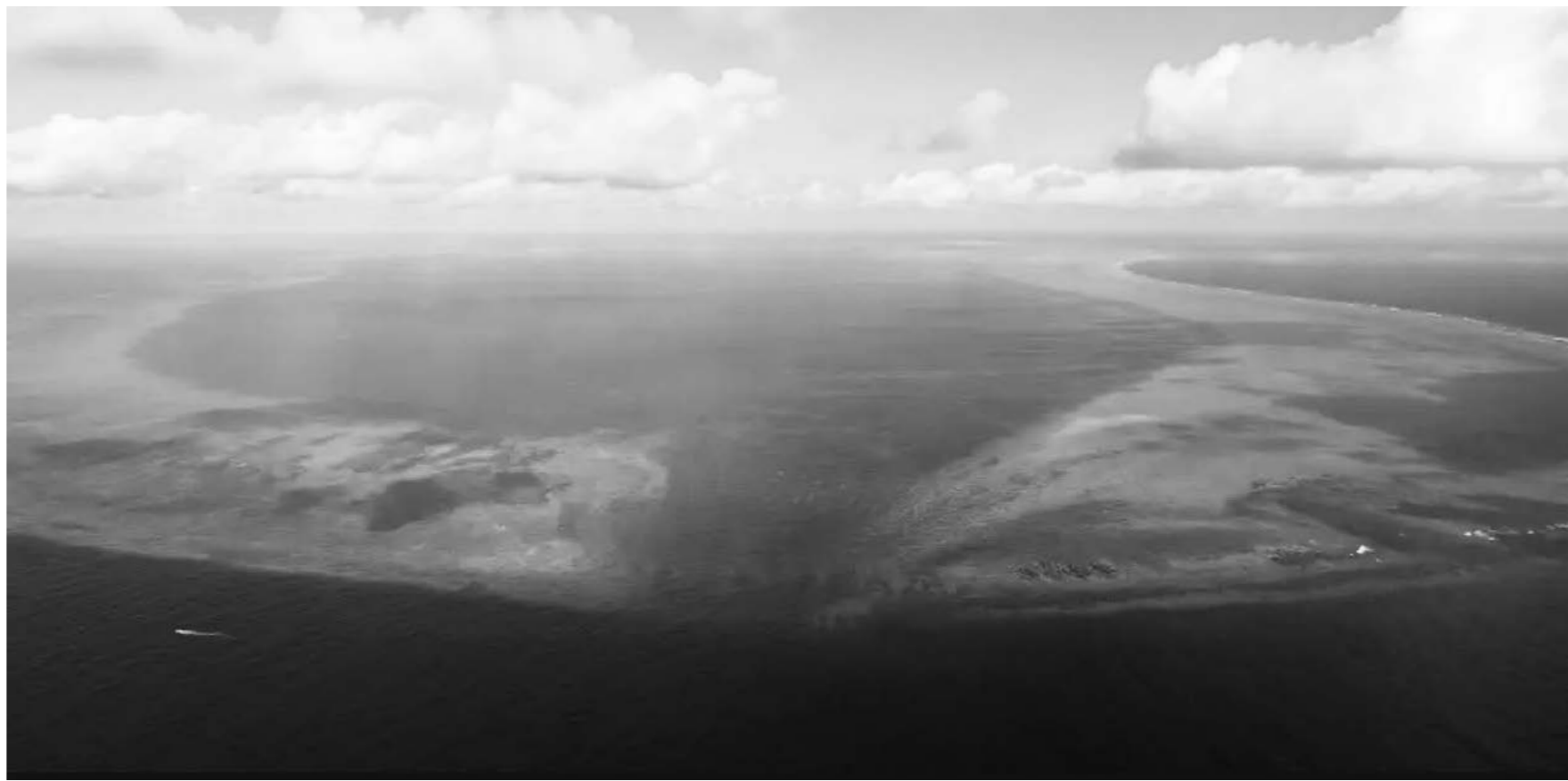
5월 12일 황암도 석호 어귀 (潟湖口).

하늘에서 내려다보면 황암도는 윤기나는 사파이어 목걸이 (蓝宝石项链) 마냥 남해의 짙푸른 물결 속에 고요히 자리잡고 있으며 두개의 암초가 거울처럼 맑고 깨끗한 석호를 에워싸고 있다. 2025년 9월, 중국은 황암도를 국가급 자연보호구로 지정하였다. 중국 해경은 황암도 해역에서 상시 순찰과 집법을 전개하여 튼튼한 방패처럼 이 생태적 성지를 보호하고 있다.