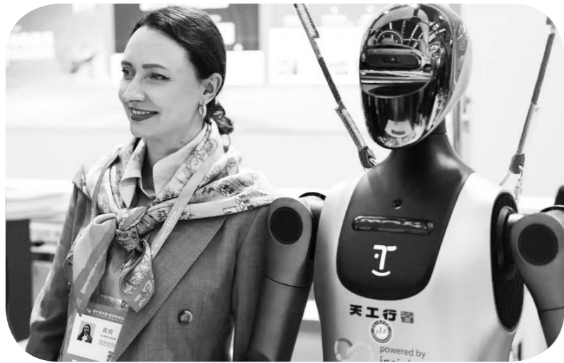
5월 17일, 할빈에서 개막된 제 10 회 중국-로씨야 박람회 현장에서 참가자가 로봇과 함께 사진을 찍고 있다.

'신뢰, 협력, 상생'을 주제로 한 이번 박람회는 상무부, 허퉁강성인민정부, 로씨야 경제발전부, 로씨야 산업통상부에서 공동으로 주최했다.