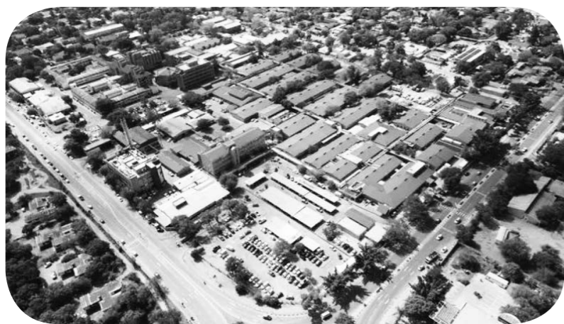
5월 4일 보쯔와나 수도 가보로네 마리나공주병원.

1981년부터 복건성은 총 17차례에 걸쳐 보쯔와나에 500여명의 의료 인력을 파견했다. 2024년 7월, 제 17진 보쯔와나 지원 의료진 45명은 보쯔와나에 도착한 후 각각 가보로네 마리나공주병원과 제 2도시 프랭 씨스타운 양가계 (仰加佳) 전원 (转诊) 병원에서 의료 지원 업무를 시작했다. 최근 2년 동안 의료진은 총 18만여명 환자를 진료하고 5,000여차 수술에 참여했으며 7차례 무료 진료 활동을 전개하고 1,000여명의 현지 의료 인력을 양성했다.