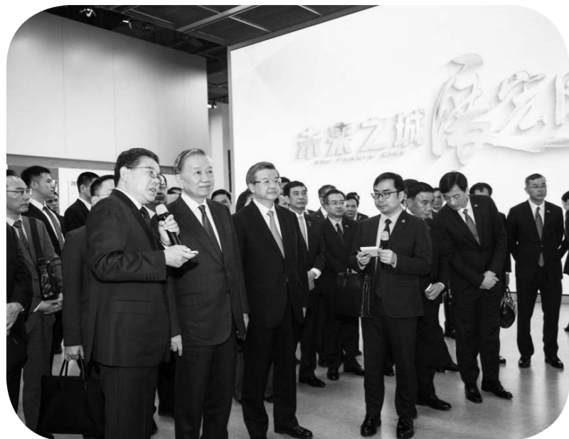
또렘이 용안신구 기동구 종합서비스센터를 참관하고 있다.

4월 14일 오전, 베트남공산당 중앙위원회 총서기이며 국가주석인 또렘은 4일간의 국빈방문 일정으로 중국을 찾았다. 북경 도착후 또렘은 곧바로 고속철을 타고 용안신구를 참관했다. 약 45분간 이동 끝에 또렘 일행은 이 '미래도시'에 들어섰다.