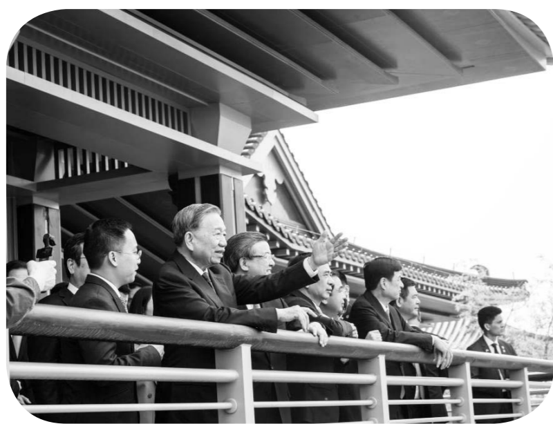
또렘이 용안신구 중앙그린벨트(中央綠谷)를 참관하고 있다.