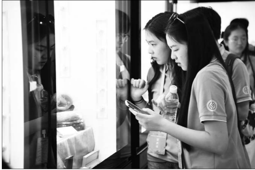
2025년 7월 4일, 제 22 회 '대만 청년 1,000 명 하계캠프'에 참가한 대만 동포들이 중산대학 지질광물박물관을 참관하고 있다.

중국국민당 주석 정려문은 중공중앙과 습근평 총서기의 초청에 응해 방문단을 이끌고 4월 7일부터 12일까지 대륙을 방문했다. 습근평 총서기는 정려문 주석을 회견하고 중요한 연설을 발표, 량당과 량안 관계의 발전 방향을 명확히 제시했다. 량안 관계의 평화발전을 추동하고 동포들의 친밀감과 복지를 증진하기 위해 관련 부문의 협상을 거쳐 중공중앙 대만사업판공실은 권한을 위임받고 대만 다음과 같은 정책조치를 발표했다.