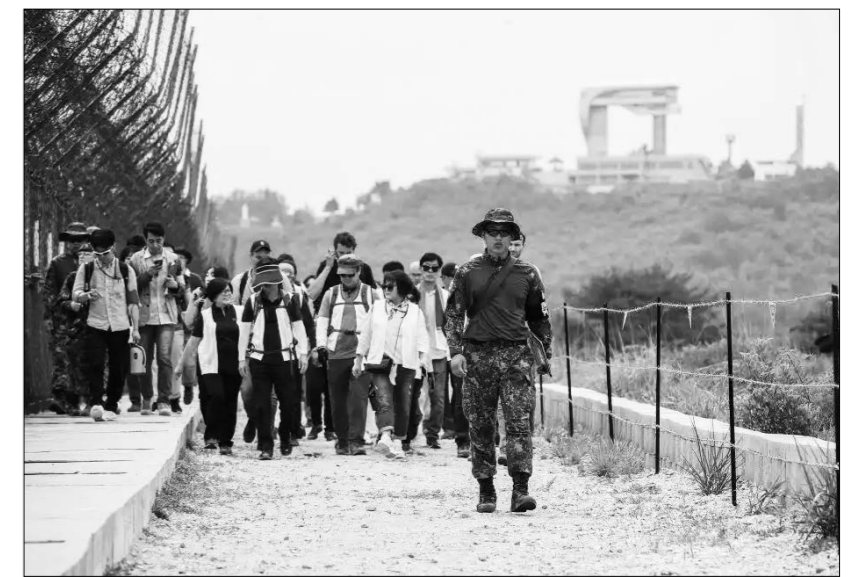
2019년 6월 14일, 관광객과 외국 기자들이 한국 고성군에 있는 '비무장지대 평화의 길'을 둘러보고 있다.

9일, 한국 국방부 장관 안규백은 국방부가 2040년까지 조선반도 접경지역 주둔 병력을 '점진적으로' 줄일 방침이라고 밝히면서 '단기간내 대폭 감축'은 아니라고 설명했다. 앞서 안규백은 기자들에게 현재 접경지역 일반 초소에 배치된 2만 2,000명의 병력을 약 6,000명 수준으로 줄이는 한편 인력 대신 인공지능 기술 기반 감시장비를 도입할 계획이라고 말했다.