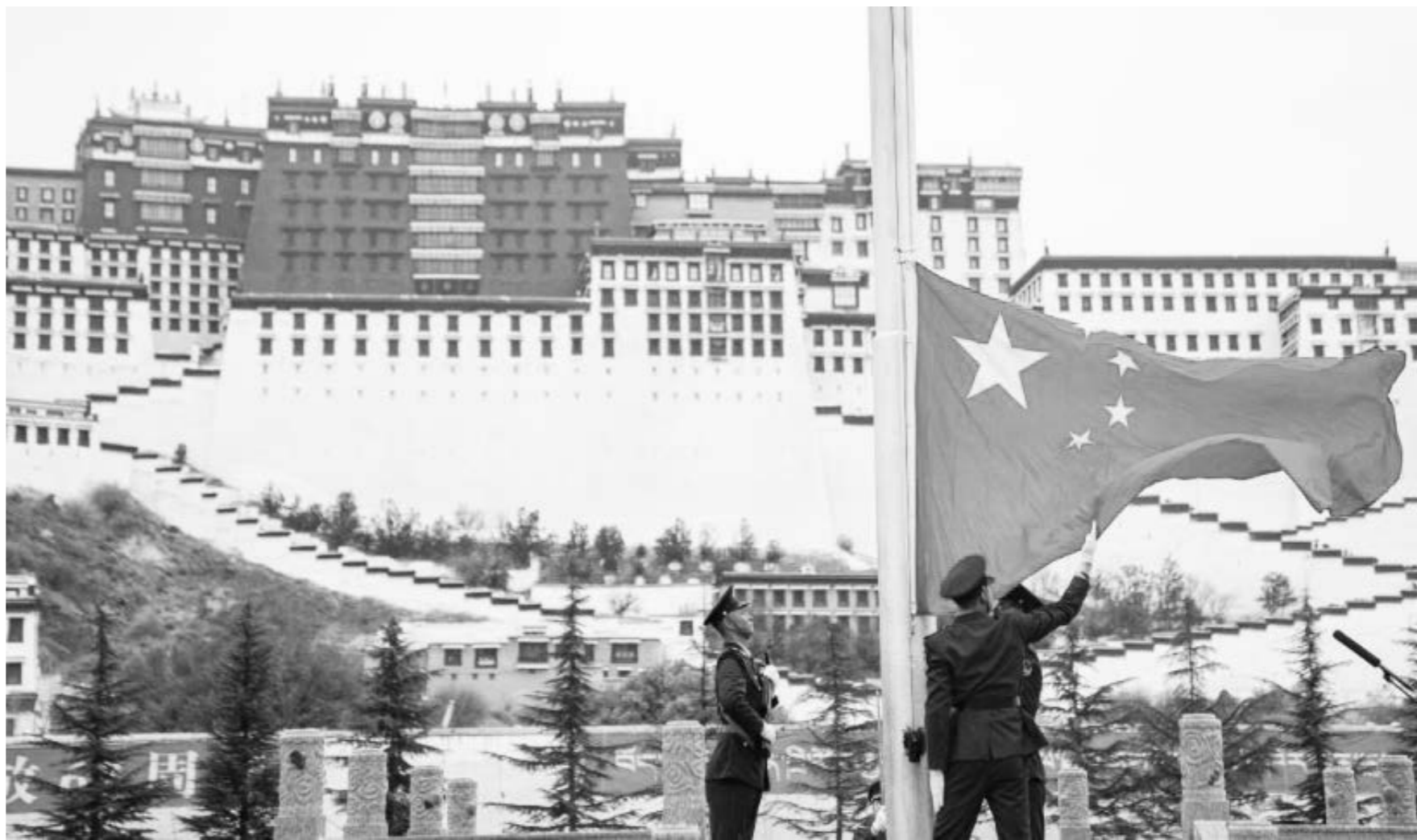
3월 28일, 부다라궁광장에서 국기계양식을 거행하여 서장 백만 농노 해방 67주년을 성대히 기념했다. 이날 서장 각 민족 군중은 국기를 계양하고 국가를 제창하며 노래하고 춤추는 등 성대한 행사를 통해 백만 농노 해방 67주년을 뜻깊게 기념했다.