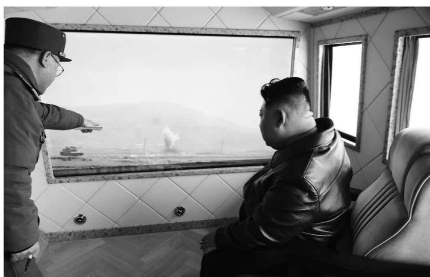
김정은이 국방과학원 장갑무기연구소가 조직한 탱크 능력 평가 시험을 참관하고 있다. 조선중앙통신이 3월 29일 보도한 바에 따르면 조선로동당 총비서이며 국무위원장인 김정은은 탄소섬유 복합재료를 리용한 대출력 고체 발동기 지상 분출 시험과 국방과학원 장갑무기연구소가 조직한 탱크 능력 평가 시험을 참관하였다.