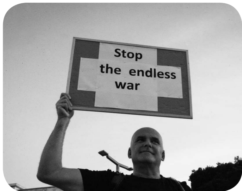
한 남성이 피켓을 들고 반전 집회에 참가하고 있다.

3월 28일, 이스라엘 텔아비브에서 시민들이 반전 집회를 열고 미국과 이스라엘의 군사 행동에 항의, 모든 전쟁 행위를 중단할 것을 요구했다.