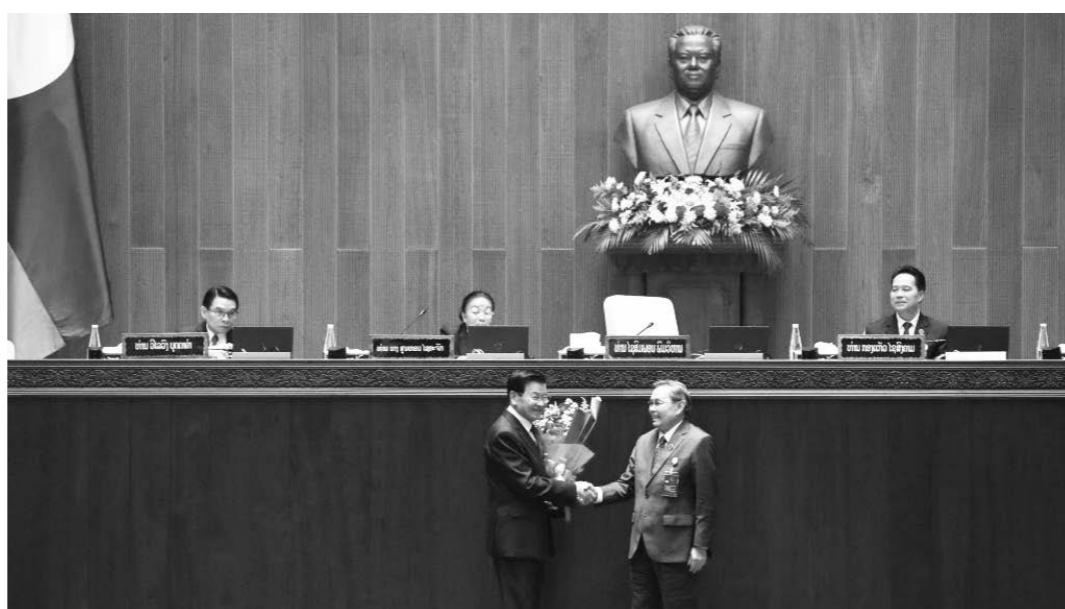
3월 23일, 라오스 수도 비엔티안에서 라오스 국회 주석 사이썬퐁(오른쪽)이 국가주석으로 당선된 통룬(왼쪽)에게 꽃다발을 전하며 축하하고 있다. 이날 오전 비엔티안에서 라오스 제 10기 국회 제 1차 회의가 개막되었다. 회의에서는 라오스인민혁명당 중앙위원회 총서기 통룬 시술릿을 국가주석으로, 라오스인민혁명당 중앙정치국 위원 솜사이 시판돈을 정부 총리로 선출하였다. 이날 회의에서는 또 라오스인민혁명당 중앙정치국 위원 사이썬퐁 품비안이 제 10기 라오스 국회 의장으로 선출되었으며 국가 부주석, 부총리, 국회 부주석도 함께 선출되었다.