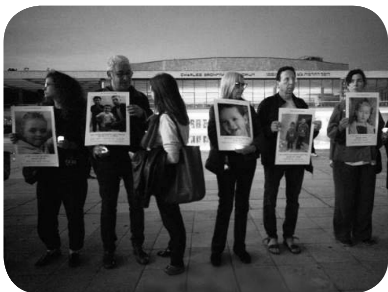
사람들이 최근 한달간의 전쟁에서 숨진 이스라엘, 팔레스티나, 레바논, 이란 어린이들의 영정사진을 들고 집회에 참가하고 있다.