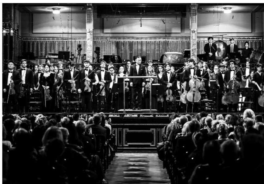
'화합과 함께 즐기는 음악—중국·헝그리아 친선교류음악회'가 3월 25일 저녁 헝그리아 부다페슈트 리스트 음악학원 공연장에서 개최되었다.