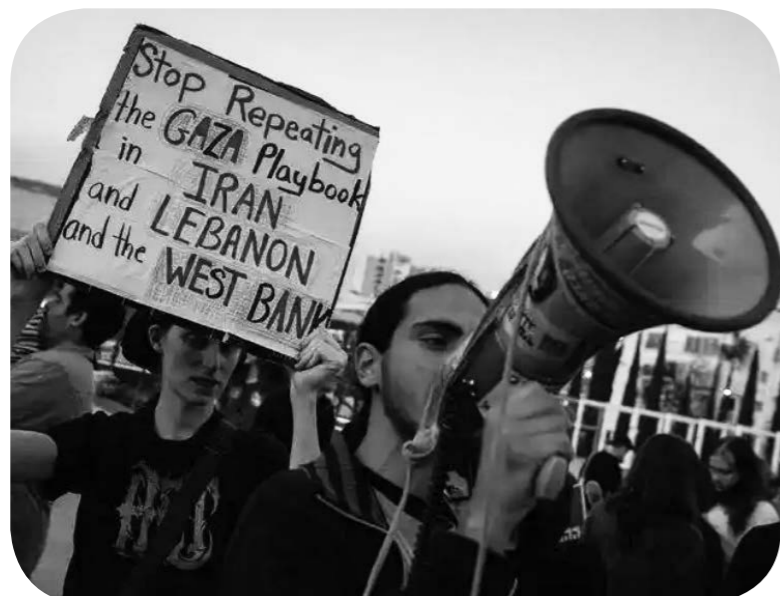
사람들이 피켓을 들고 반전 집회에 참가하고 있다.