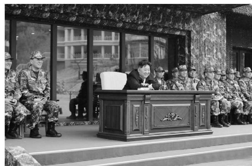
김정은이 특수작전훈련기지를 시찰하고 있다. 조선중앙통신이 3월 29일 보도한 바에 따르면 조선로동당 총비서이며 국무위원장인 김정은은 조선인민군 총참모부 작전국 직속 특수작전훈련기지를 방문하고 각급 특수작전구분대의 훈련 실태를 료해하였다.