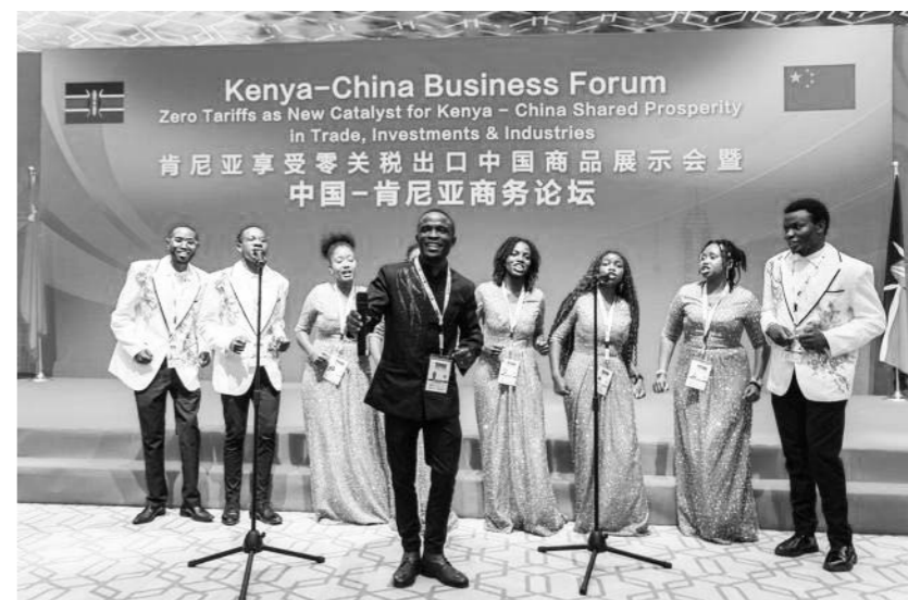
3월 23일, 케니아 무관세 중국 수출 상품 전시회 및 중국—케니아 비즈니스포럼이 케니아 수도 나이로비에서 열린 가운데 현장에서 사람들이 공연을 하고 있다.