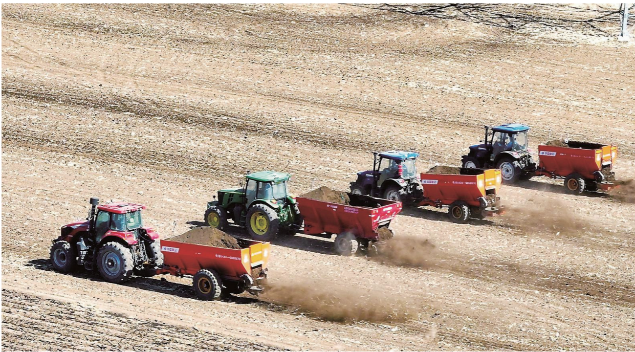
▲ 춘경을 앞두고 공주령시 쌍성보진의 옥수수밭에서 승림농민전문합작사 유기질비료 살포기가 질서 있게 작업을 진행하고 있다.

농자재의 우수한 질과 충족한 량을 보장하기 위해 전 성에서는 2월중순부터 종자, 화학비료, 농약 등 생산물자의 공급 수요를 파악하고 제때에 부족한 부분을 조절하며 가짜 및 불량 농자재에 대한 단속을 강화하고 가짜 및 불량 농자재 제조 판매를 엄격히 타격하여 농가에서 안심하고 춘경 준비를 하고 농사를 지을 수 있도록 보장했다.