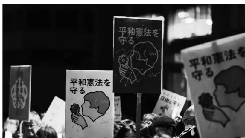
2월 27일, 도쿄 수상 관저 앞에서 시민들이 파켓을 들고 시위에 참여하고 있다. 일본 수상 다카이치 사나에가 최근 보인 개헌 신호와 관련, 많은 일본 시민들이 이날 밤 집회를 열고 다카이치의 개헌 시도에 항의했다.