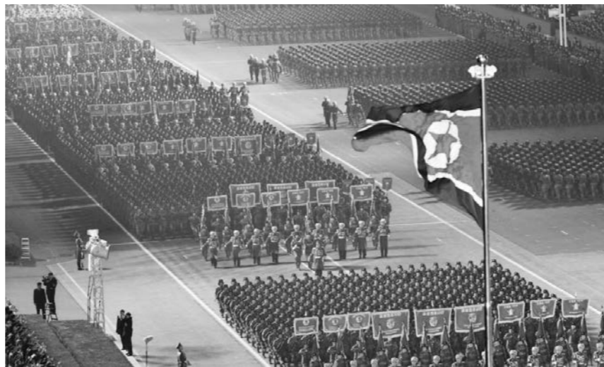
조선중앙통신의 2월 26일 보도에 따르면 조선은 25일 평양 김일성광장에서 조선로동당 제9차 대회 기념 열병식을 거행했다. 사진은 열병식 현장이다.