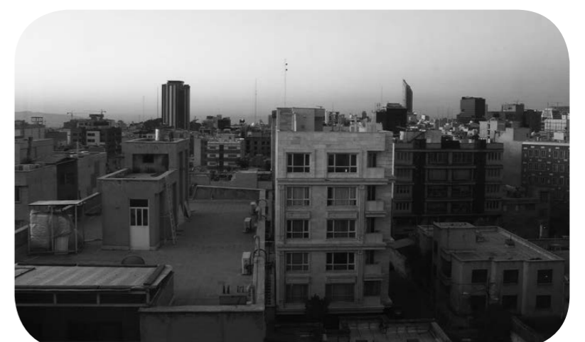
3월 1일 아침 찍은 이란 수도 테헤란 시내 모습