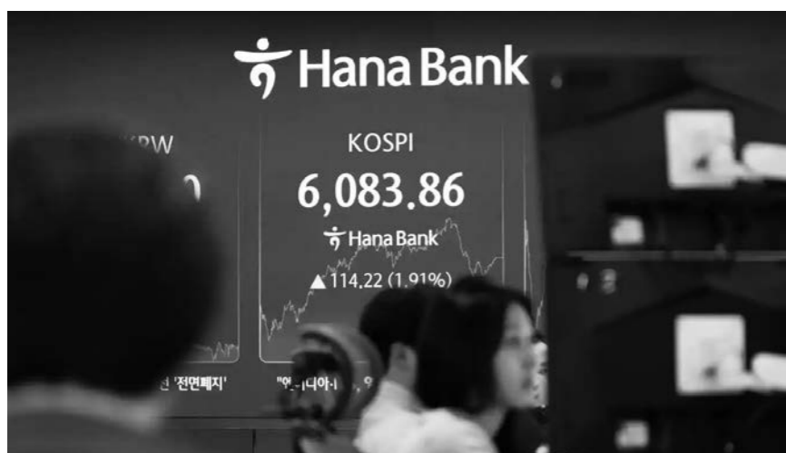
2월 25일, 직원이 서울의 한 은행 거래 대형 스크린 앞에서 일하고 있다. 이날 한국 종합주가지수(KOSPI)는 6,000 포인트를 돌파하며 6083.86 포인트로 장을 마감했다.