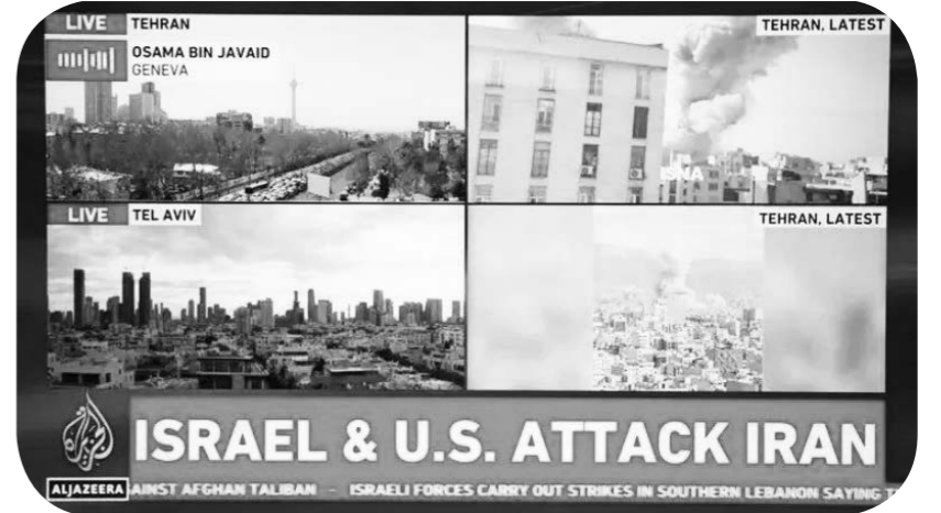
2월 28일, 알자지라방송(半岛电视台) 생중계 화면에 미국과 이스라엘이 이란을 상대로 합동군사작전을 개시하는 모습이 포착됐다. 카타르 알자지라방송은 이날 미국 관리의 말을 인용해 미국과 이스라엘은 이란 안전 시스템을 파괴할 목적으로 합동군사작전을 감행했다고 보도했다.