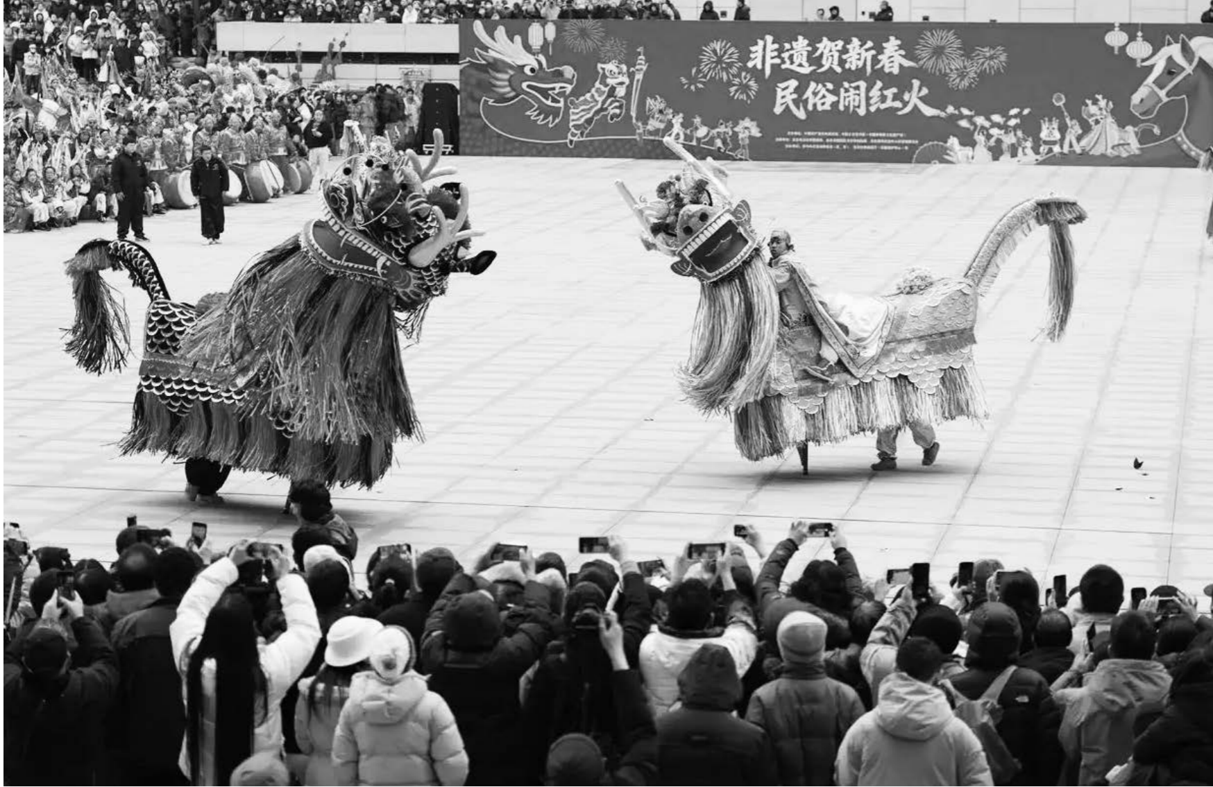
2월 28일, 관람객들이 허북 민속공연팀의 기린무(麒麟舞)를 관람하고 있다. 이날 중국공예미술관(중국무형문화유산관)과 중국공산당력사전시관에서 공동 주최한 '무형문화유산으로 새해 맞이, 민속으로 흥겨운 정월대보름' 행사가 열렸다. 북경, 쑤저, 산서, 절강, 내몽골 등 8개 성·시·자치구에서 온 민속공연팀은 증장대고(曾庄大鼓), 기린무, 수양족마극(寿阳高跷竹马戏), 몽골족 마두금 연주 등 14가지 민속 공연을 관람객들에게 선보였다.