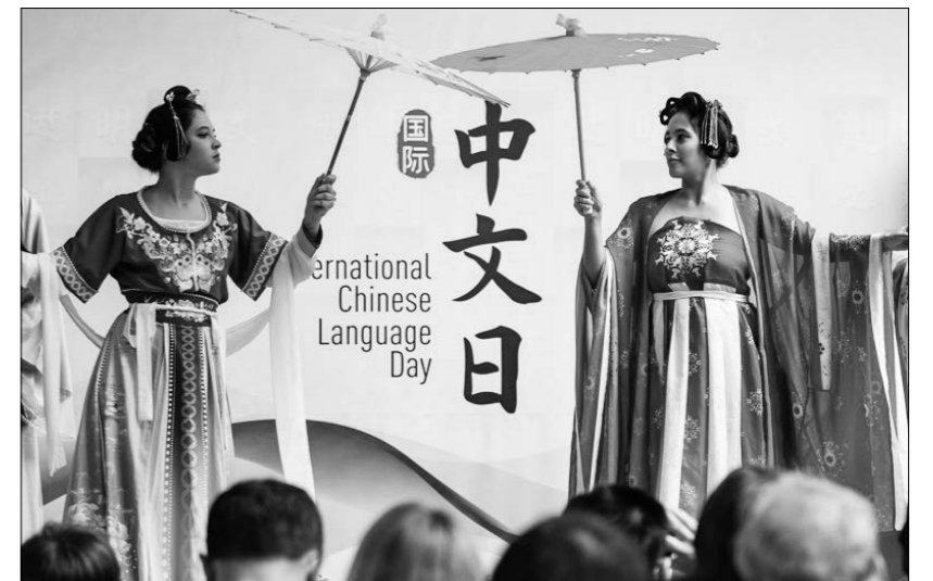
4월 19일, 공연자들이 브라질 리오데자네이로의 유엔 중문의 날 행사에서 한복(汉服)을 전시하고 있다. 이날 행사에서 관중들은 한복, 무술과 다예 등 공연을 감상하고 중국서에, 중국음식, 중국어과정과 중의학문화를 체험하고 료해했다. / 신화넷

11일부터 12일까지 브라질 상뻬울에서 '글로벌 사우스' 미디어·싱크탱크 고위급 포럼이 열렸다. 포럼 기간에 싱크탱크 보고서 <새로운 인류문명 형태의 세계적 의의>가 발표됐다. 보고서는 중국식 현대화가 인류문명의 새로운 형태를 창조하는 데 담긴 독특한 의미와 위대한 실천, 세계적 의의를 포괄적이고 심도 있게 해석하고 설명했다. / 신화넷