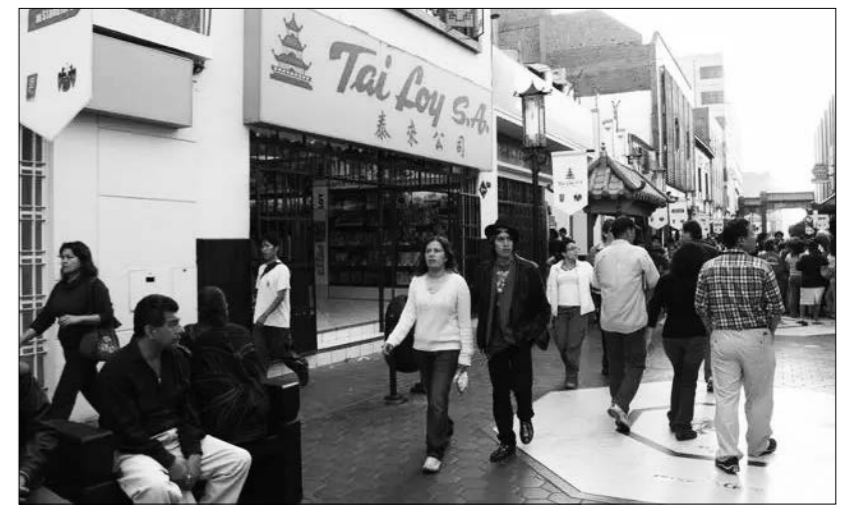
2008년 11월 15일, 행인들이 뻬루 수도 리마의 중국거리를 거닐고 있다.

중국-뻬루 '일대일로' 공동건설 실무협력 년례회의가 8일 뻬루 수도 리마에서 열렸다. 회의에 참석한 귀빈들은 '일대일로' 공동건설 틀 아래 양국의 새로운 협력 기회를 심도 있게 논의하고 미래 발전의 새로운 비전에 대해 대화를 나눴다. 회의 기간 각측은 다수의 실무 성과를 거뒀다. 신화사 국가고급싱크탱크는 <고품질 발전 공동 추진 및 아시아태평양 운명공동체 구축>