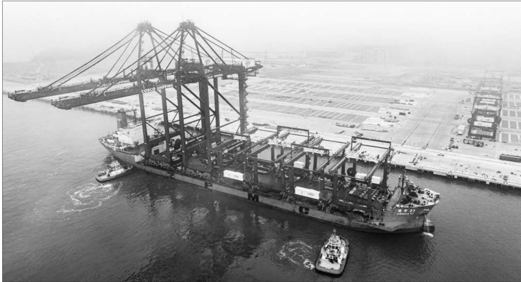
6월 27일, 중국에서 온 해안 컨테이너 크레인(集装箱起重机)과 레일 크레인(轨道吊运)이 뻬루 찬카이항에 도착하고 있다. 찬카이항은 중국-뻬루 '일대일로' 공동건설 협력 프로젝트이다.

습근평 국가주석이 뻬루 대통령 디나 볼루아르테의 초청으로 13일부터 17일까지 제 31차 아시아태평양경제협력체(APEC) 지도자 비공식회의의 참석차 리마를 찾은 것은 이번이 두번째이다. 습근평 주석의 뻬루 방문은 어떤 중요한 관전 포인트가 있는지 몇가지 키워드를 통해 알아보자.