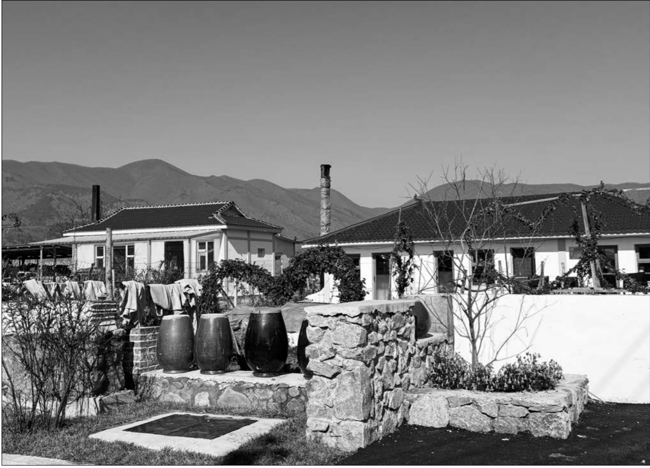
룡정시 삼합진 북흥촌

올해 룡정시는 대중들이 가장 관심하고 대중들의 리익에 가장 직접적으로 관계되는 일들로부터 출발해 부단히 대중들의 민생복지를 증진하고 대중들의 아름다운 생활에 대한 념원에 부응해 시민들의 행복감을 증진시키고 만족감을 충족시켰다.