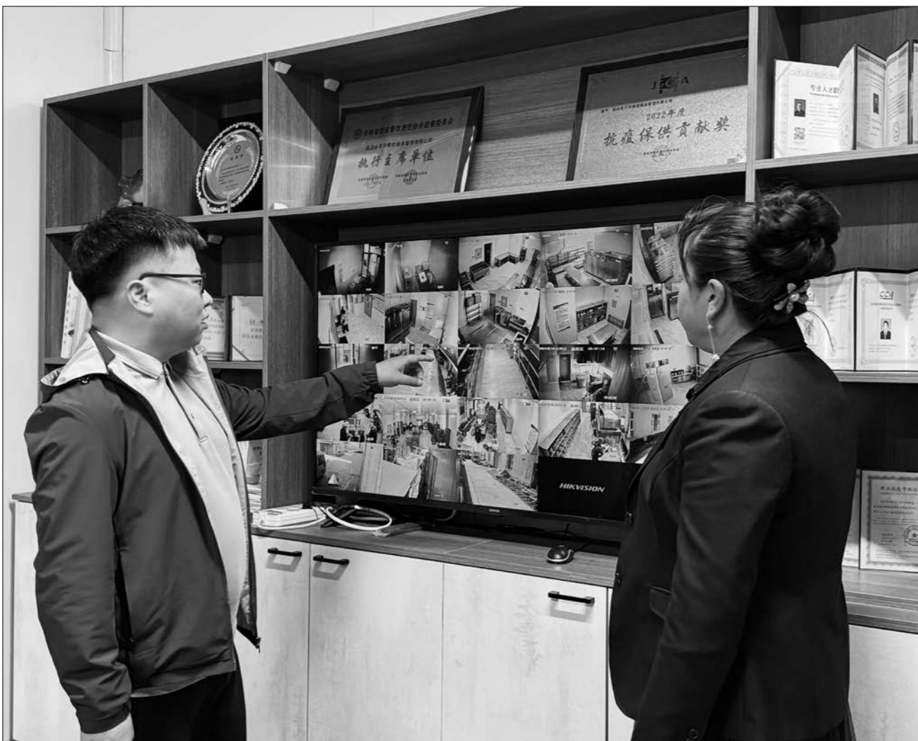
주방 곳곳에 여러대의 감시카메라를 설치하여 실시간으로 감독관리