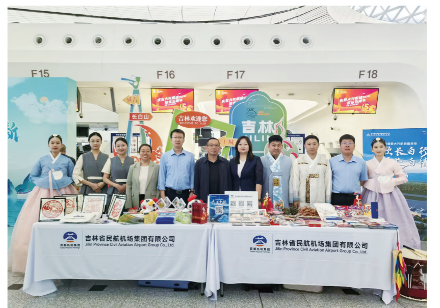
▲ 제 4회 '925 대흥공항축제' 연변부스

최근, 길림공항그룹의 통일적인 조직하에 연길조양천국제공항(이하 '연길공항')은 연변조선족자치주 문화라이프비즈니스방승밋관광국과 함께 제 4회 '925 대흥공항축제'에 참가했다.