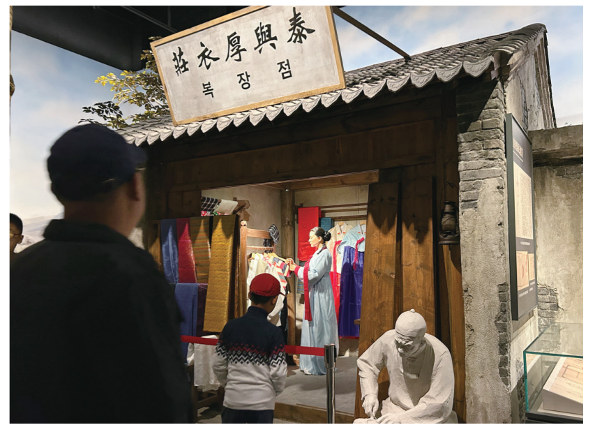
▲ 연변박물관을 둘러보고 있는 관광객들

국경절 연휴 기간 연변박물관이 방문객들로 장사진을 이룬 가운데 10월 1일부터 3일까지 연 2만 1,000여명의 방문객이 연변박물관을 찾았으며 3일에는 하루 동안에만 8,123명이 방문해 역대 최고 기록을 경신했다.